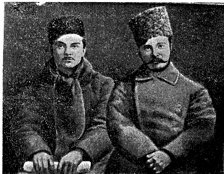
М. В. Фрунзе и Д. А. Фурманов в период гражданской войны.

После получения приказа дунганский кавполк был разбит на несколько отрядов, которые двинулись в селения, где расположились банды белогвардейцев. Один из эскадронов, вступив в Чилик, застиг белогвардейцев врасплох. Последние бежали в горы. Эскадрон захватил до 3000 спрятанных винтовок, гранаты и пулеметы. Преследуя бежавших белогвардейцев, эскадрон полка навязал им несколько стычек, в которых противник потерял свои основные силы.